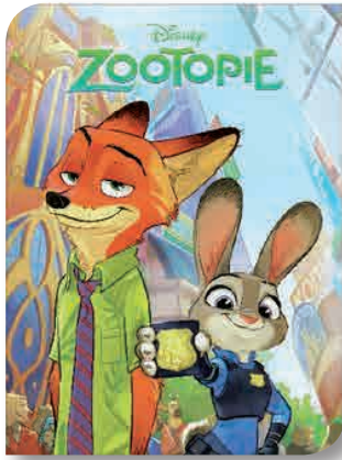
Zootopie de DISNEY